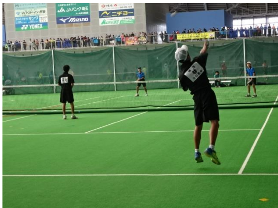
県大会男子ソフトテニス個人戦(熊谷ドーム)