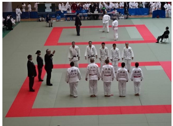
県大会柔道男子団体戦(県立武道館)