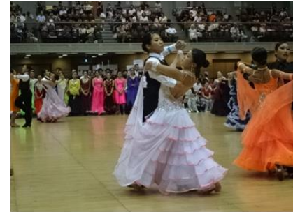
ダンス部 中央区総合スポーツセンターにて