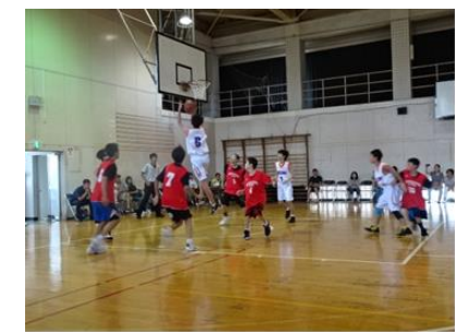
男子バスケットボール部県大会出場