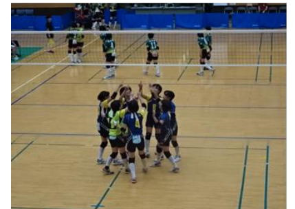
女子バレーボール部県大会出場