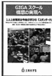
GIGAスクール構想の実現へ(リーフレット)

学習者用の1人1台端末と、高速通信ネットワークを一体的に整備することで、多様な子供たちそれぞれに最適な学びを実現するために、国が進める教育政策です。